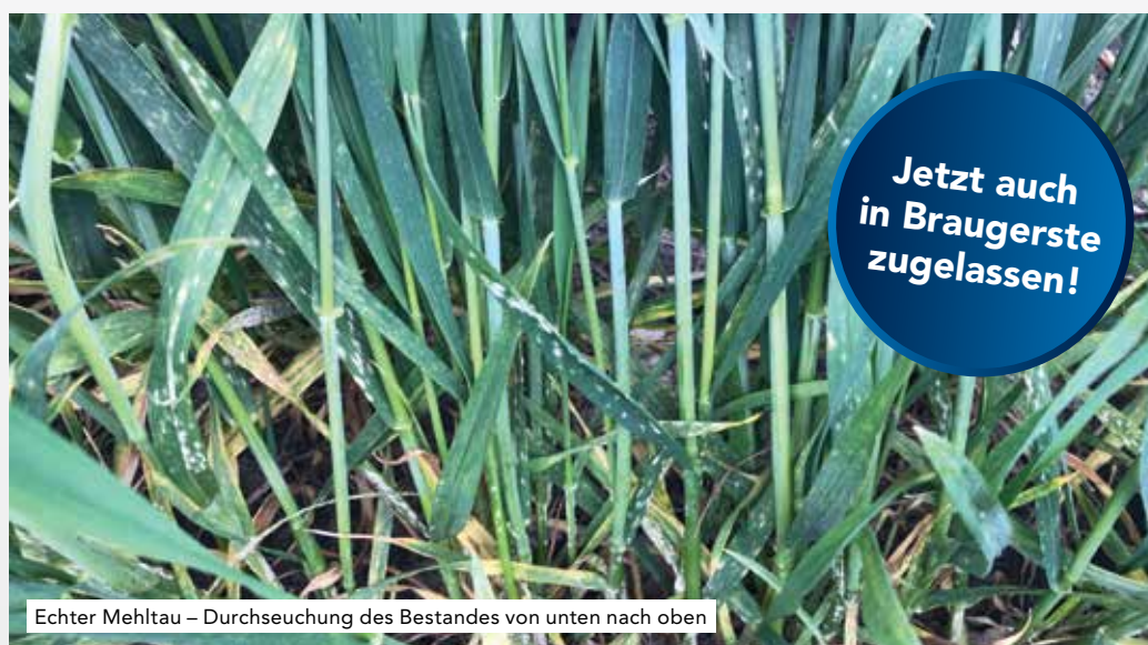
Echter Mehltau – Durchseuchung des Bestandes von unten nach oben